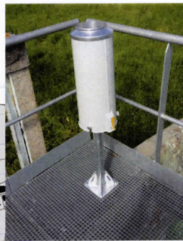
Un des pluviomètres mesurant l'intensité des pluies sur la vallée.